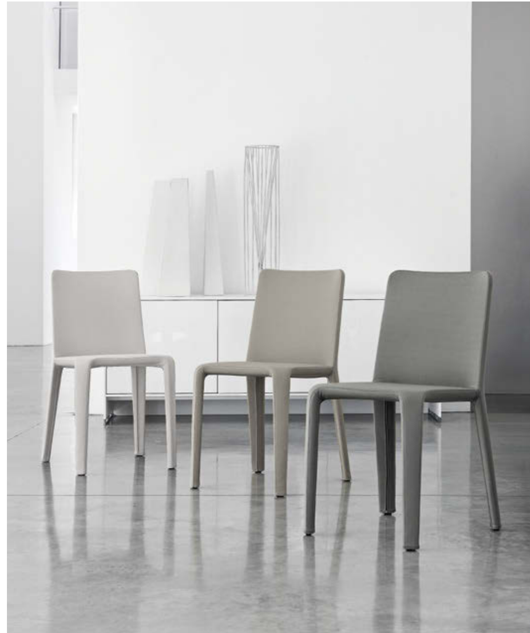
My Time Dondoli e Pocci