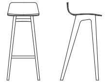
frame // Gestell h 80 cm