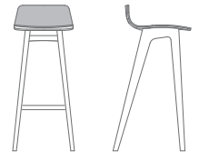
padded seat // Sitzpolster

Kundenstoff/Leder // customer's own fabric/leather