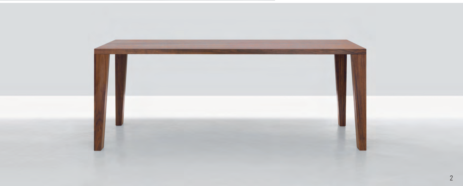
1, 2 SLASH, amerikanischer Nussbaum